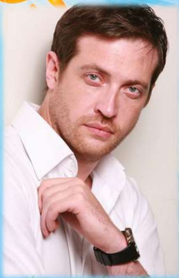
Кирилл Сафонов – актер театра и кино