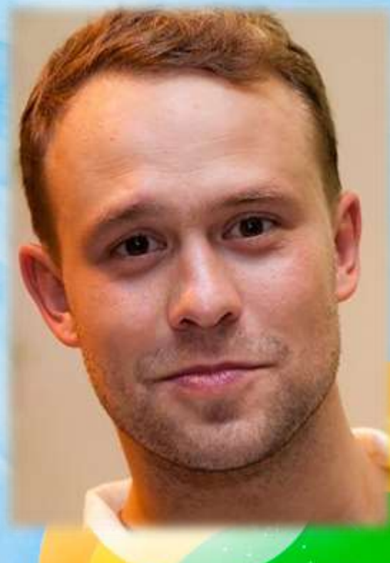
Кирилл Плетнёв – актер театра и кино