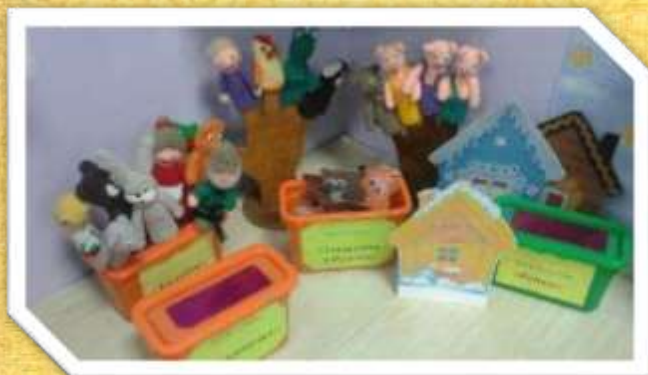
Младшая разновозрастная группа